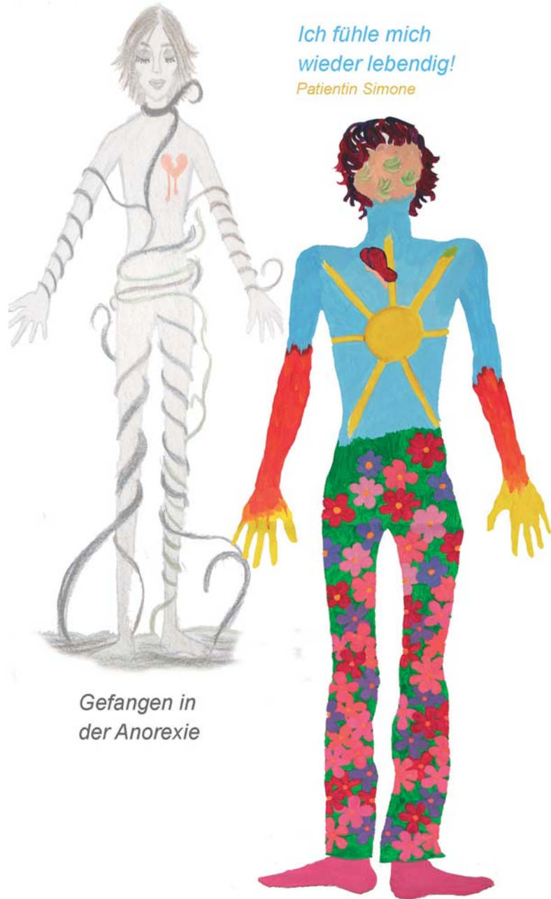
Gefangen in der Anorexie

Eine Psychotherapie ist immer so gut wie die Atmosphäre, in der sie stattfindet! Daher legen wir großen Wert auf heilsame Rahmenbedingungen.